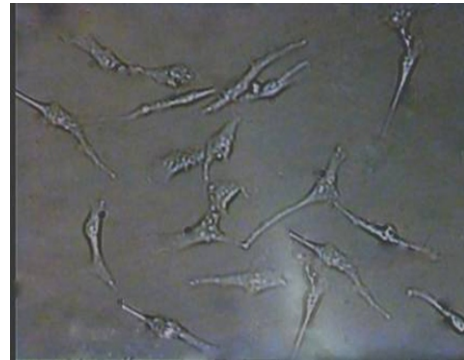
شکل ۱: مورفولوژی سلول‌های اندوتلیال جدا شده توسط آنزیم اکتینیدین ۲۴ ساعت پس از جداسازی (میکروسکوپ معکوس با بزرگنمایی ۱۰۰) (مشاهده نمونه رنگی تصویر در انتهای مقالات)

اکتینیدین یک سیستمین پروتئاز است که در میوه کیوی به وفور یافت می‌شود (۱۲). تاکنون مطالعات معدودی اثر هیدرولازی این آنزیم را بر کلاژن بررسی کرده‌اند (۱۸-۱۶) ولی نتایج حاصله حاکی از عدم فعالیت کلاژناز آن بوده است. برای مثال، موریموتو و همکارانش گزارش کرده‌اند که اکتینیدین قادر به هیدرولیز ماریپچ سه تایی کلاژن نیست، اما در pH اسیدی می‌تواند آنلوکلاژن (کلاژن هیدرولیز شده با پپسین) را هضم کند (۱۸). در مقایسه با مطالعات فوق، مصطفایی و همکاران نشان دادند که آنزیم اکتینیدین اگر در pH خنثی یا قلیایی ضعیف بر کلاژن اثر نماید، این پروتئین را هیدرولیز می‌کند (۲۸). با توجه اثر اکتینیدین در ترد کردن گوشت و اثر کلاژنازی آن، در این مطالعه از این آنزیم با هدف جداسازی سلول‌های اندوتلیال سیاهرگ بندناف انسان، در مقایسه با کلاژناز استفاده شد. نتایج نشان داد که اکتینیدین در غلظت ۴ میلی گرم در میلی لیتر در مدت زمان ۲۰-۳۰ دقیقه قادر است سلول‌های اندوتلیال را از جدار داخلی سیاهرگ بندناف جدا کند. بقای سلول‌های جدا شده در این شرایط ۹۵-۹۰ درصد تخمین زده