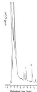
شکل ۱: کروماتوگرام استخراج ویتامین E از پلاسمای خون ورید کلیه راست در گروه کنترل (منحنی ۱ نمایانگر ویتامین E، منحنی ۲ ناشی از ویتامین E استات و بقیه منحنی‌های نامشخصه هستند)

شکل ۲ و نشان دهنده مقایسه کروماتوگرامهای ویتامین E استخراج شده از پلاسما در گروه کنترل و گروه IR است. زمان