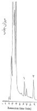
شکل ۲: کروماتوگرام استخراج ویتامین E از پلاسمای خون ورید کلیه راست در گروه (IR) (منحنی ۱ نمایانگر ویتامین E، منحنی ۲ ناشی از ویتامین E استات و بقیه منحنی‌های نامشخصه هستند)

بازدارندگی ویتامین E در هر دو گروه یکسان است ولی ارتفاع و سطح زیر منحنی پیکها در گروه IR (شکل ۲) کمتر از گروه کنترل است (شکل ۱). این مطلب در مورد کروماتوگرام ویتامین E در بافت کلیه صدق می‌کند.